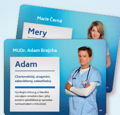
6 karet lékařů