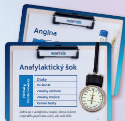
120 karet pacientů