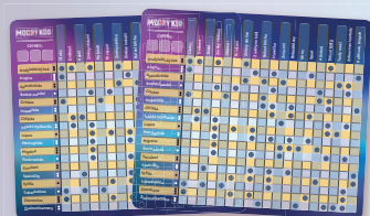
6 mazatelných diagnostických destiček