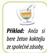
Příklad: Anča si bere žeton koktejlu ze společné zásoby.

Dodatek: Jakmile se tato karta setkání objeví ve hře, vytvoříte společnou zásobu 3 žetonů koktejlu. Hráč, který tuto akci aktivoval, si pak 1 žeton koktejlu ze společné zásoby vezme – pokud se v ní však už žádný žeton koktejlu nenachází, všichni hráči své žetony koktejlu do společné zásoby vrátí (a tím je možné akci dokončit).