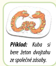
Příklad: Kuba si bere žeton dvojtahu ze společné zásoby.

Dodatek: Jakmile se tato karta setkání objeví ve hře, vytvoříte společnou zásobu 3 žetonů dvojtahu. Hráč, který tuto akci aktivoval, si pak 1 žeton dvojtahu ze společné zásoby vezme – pokud se v ní však už žádný žeton dvojtahu nenachází, všichni hráči své žetony dvojtahu do společné zásoby vrátí (a tím je možné akci dokončit). Žeton dvojtahu není možné použít ve stejném tahu, kdy jej hráč získal.